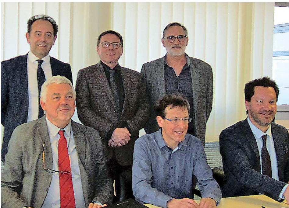
Le partenariat a été formalisé le 28 mars par la signature d'un ensemble de conventions entre les trois établissements concernés par le dispositif.

de préparation des chimiothérapies de l'ICLN. Les patients bénéficient ainsi d'une prise en charge cohérente et complète sur place, limitant les temps de trajet et la fatigue induite.